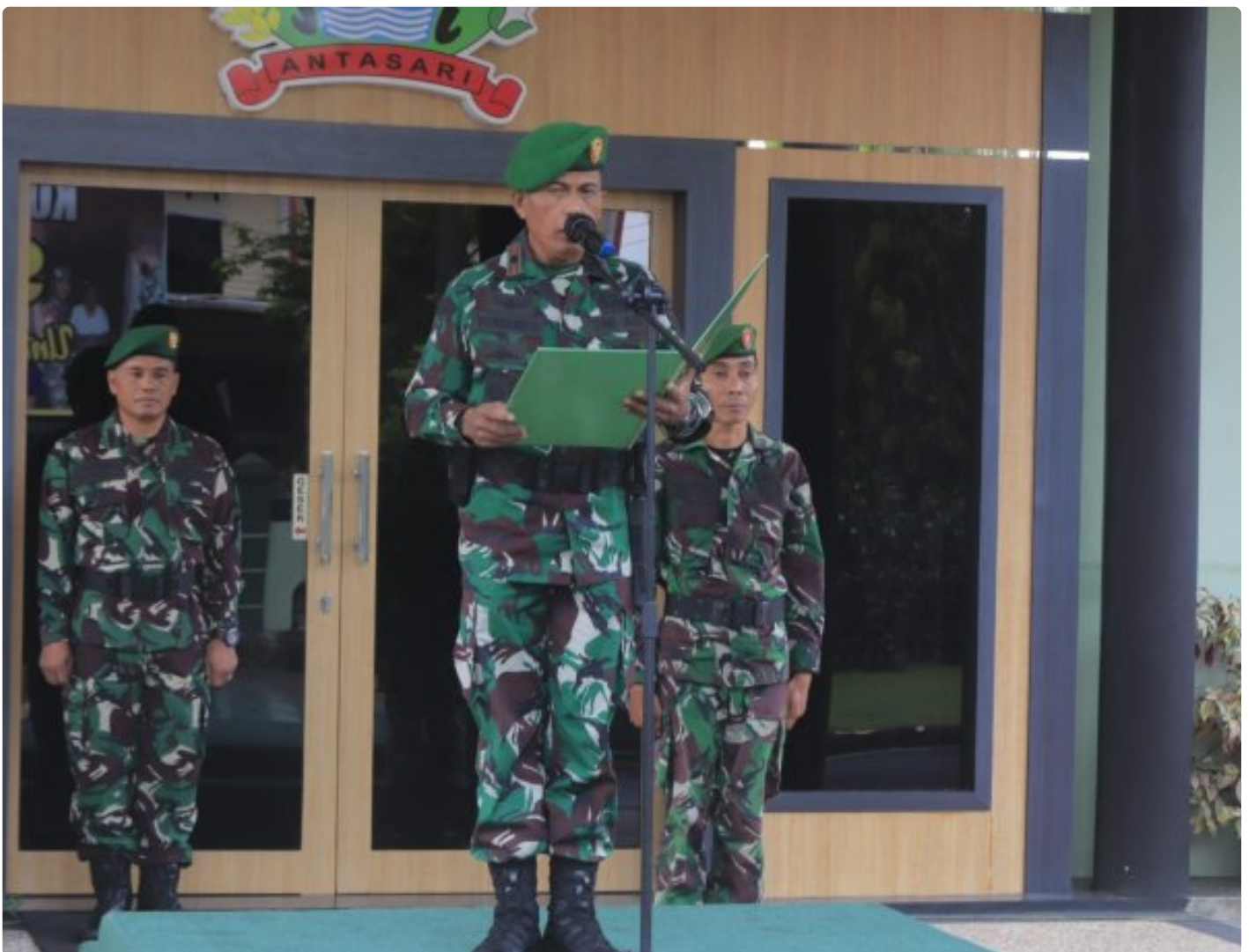
Makna Upacara Bendera Merah Putih Dibulan Suci Ramadhan Bagi Prajurit Kodim 1006/Banjar

MARTAPURA - Bagi Prajurit TNI AD Upacara Pengibaran Bendera Merah merupakan suatu keharusan dilaksanakan.